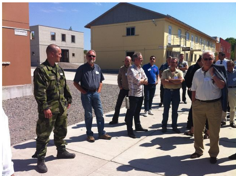
SIB Kvarn är försvarets toppmoderna anläggning där strid i bebyggelse övas.